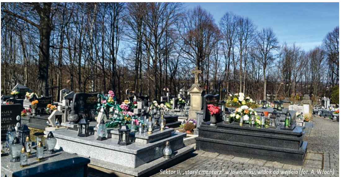
Sektor II, „stary cmentarz” w Jaworniku, widok od wejścia

Wracając w kierunku wejścia cmentarza w sektorze II, dostrzegalny jest nagrobek z początków XX wieku po prawej stronie. Postument składa się z kilku elementów, spoczywa na cokole, a jego kapitel zwieńczony jest krzyżem. Na dolnej części w płycinie wyryty jest napis: „PRO-SZĄ O WESTCHNIENIE DO BOGA”. Niestety, ostatnia fraza inskrypcji nie pozwala na odczytanie jej znaczenia, co sprawia, że tajemniczość tego monumentu staje się jeszcze bardziej intrygująca. Otaczająca go zieleń oraz starannie utrzymany krajobraz tworzą harmonijną