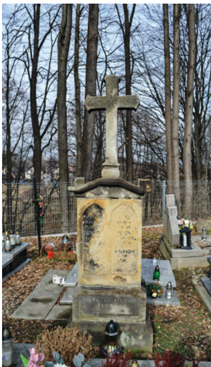
Nagrobek Stanisława i Wiktorii Zborowskich fot. archiwalna z 1993 i 2024 r. (A. Włoch)

całość, stanowiąc nie tylko punkt odniesienia dla przechodniów, ale również skromne miejsce refleksji dla tych, którzy pragną zatrzymać się na chwilę. Monument, mimo upływu lat, zachowuje swój majestatyczny charakter, przyciągając uwagę i wzbudzając szacunek. Warto poświęcić chwilę, by docenić jego historyczną wartość oraz ogromne znaczenie, jakie niegdyś miał w sercach lokalnej społeczności.