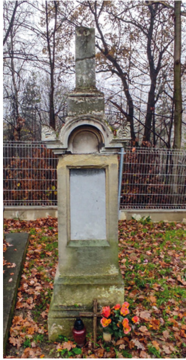
Nagrobek Marianny Łapińskiej fot. archiwalna z 1993 i 2024 r. (A. Włoch)