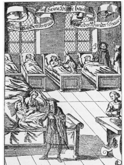
Szpital w XVII wieku

W Polsce pierwsze szpitale powstały we Wrocławiu i przy opactwie cystersów w Jędrzejowie już w XIII w. I faktycznie hospicja-szpitałe powstawały najczęściej przy klasztorach, gdzie mnisi pogłębiali swą wiedzę medycz-