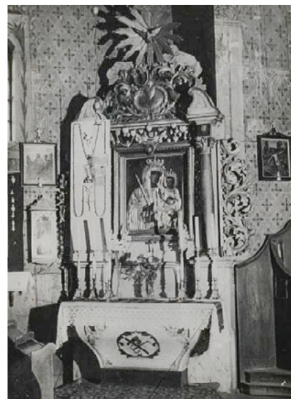
Ołtarz boczny MB Szkaplerznej w drewnianym kościele w Jaworniku