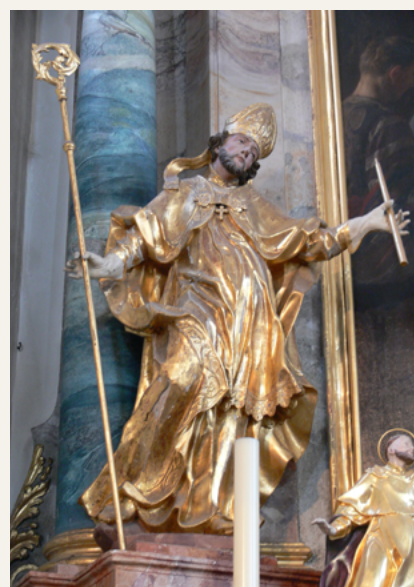
Rzeźba Matthiasa Fallera przedstawiająca św. Błażeja, znajdująca się w klasztorze w St. Märgen (1742/3) Andreas Praefcke, wikipedia CC BY 3.0,

Kult św. Błażeja był znany na całym Wschodzie i Zachodzie. Ikonografia przedstawia go najczęściej w stroju biskupa, uzdrawiającego chłopca. Święty Błażej jest szczególnym patronem miasta i diecezji Dubrownik w Jugosławii. Także w Polsce kult jego był popularny. Związane były z jego dniem różne przysłowia, jak na przykład „deszcz na św. Błażeja - słaba wiosna nadzieja” Oskar Kolberg przypomina, że w niektórych stronach Polski na dzień św. Błażeja robiono małe świece, zwane „błażejkami”, które niesiono do poświęcenia i dotykano nimi gardła. W innych stronach