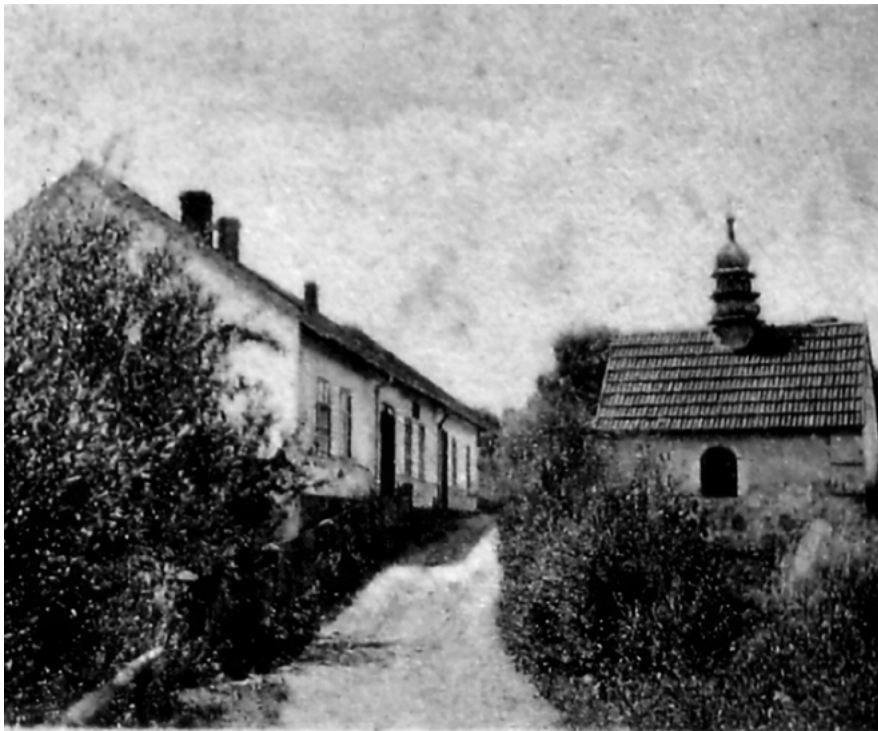
Szkoła i Kaplica.