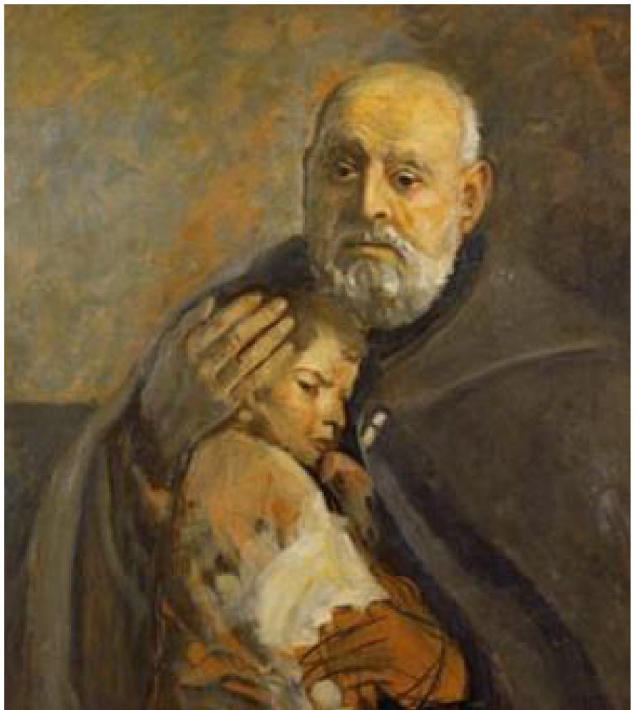
Leon Wyczółkowski, Brat Albert (1902)

Pierwszym zakonem szpitalnym działającym w Polsce było sprowadzone z Francji Bractwo Szpitalników Św. Ducha. Od roku 1221 działali oni w Krakowie, a później w kolejnych większych miastach, gdzie było najwięcej bezdomnych i chorych. Zaczę-