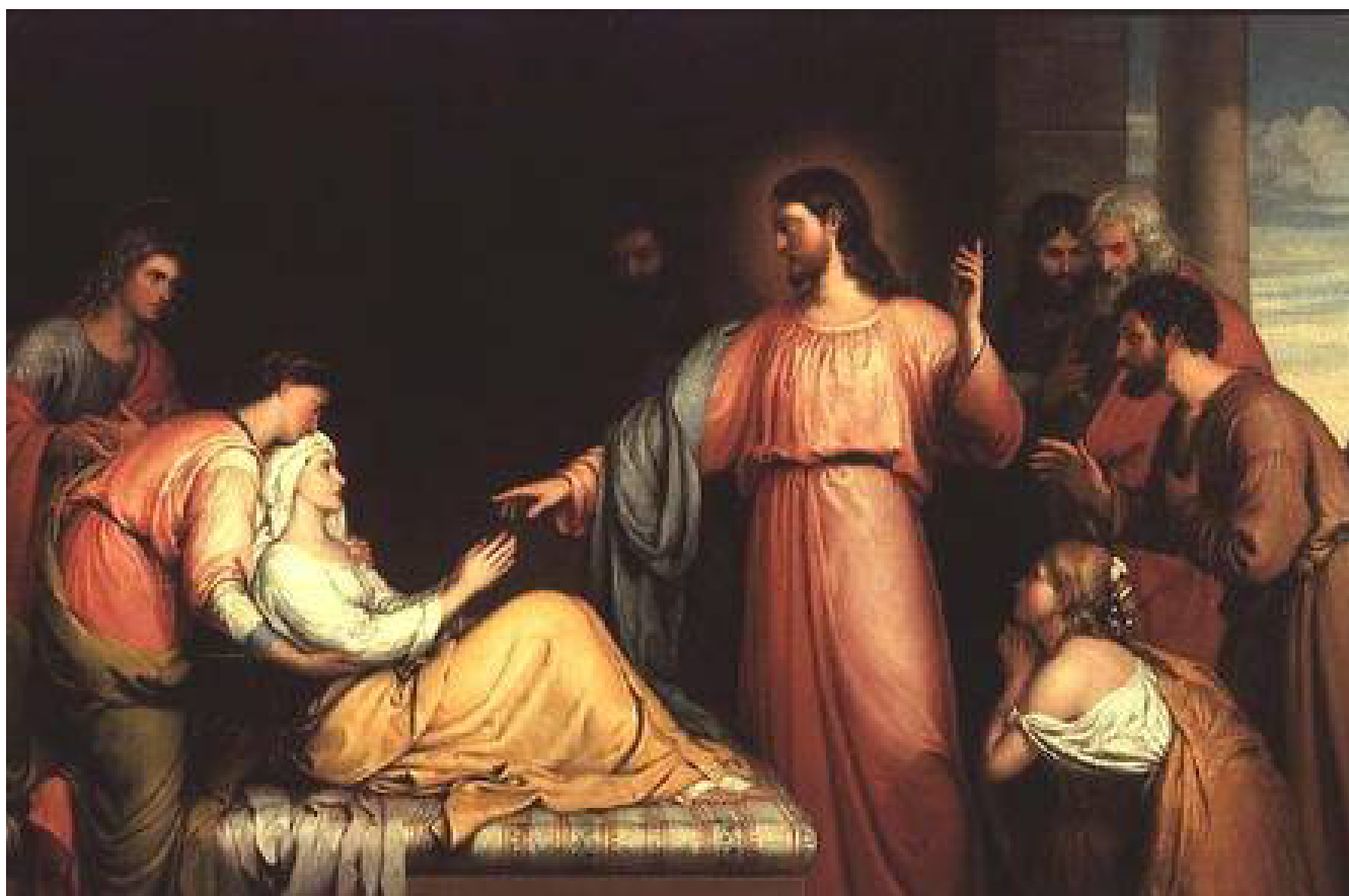
Uzdrowienie teściowej Piotra, John Bridges, XIX w. domena publiczna

li się też zajmować ciężarnymi, sierotami i porzuconymi noworodkami, które często pozostawiano przed furką klasztorną, mając pewność, że znajdą tam opiekę. Dzisiaj w wielu miejscach rolę tę spełniają Okna życia.